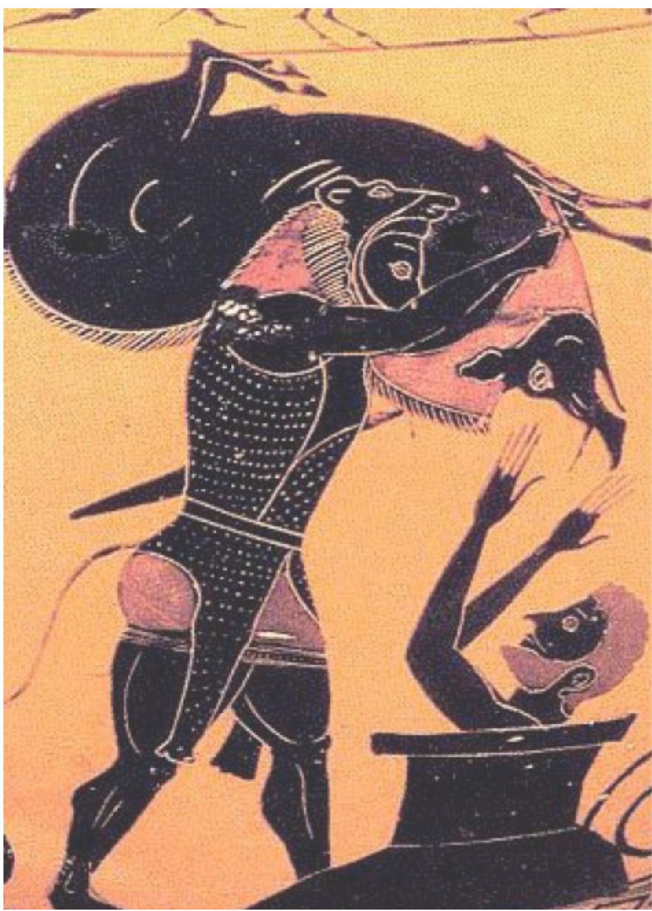
Herkül'ün Yaban Domuzu'nu yakalaması.

Eurystheus, hem Herkül'ü aşağılamak hem de bu pis işi ona yaptırmak için Augeias'ın ahırlarının temizlenmesi görevini Herkül'e verdi. Herkül ahırları temizlemeyi kabul etti. Augeias'ın yanına gitti ancak ona bir görevle geldiğini söylemedi. Bunun yerine Kral Augeias'a bir teklifte bulundu. Ahırları temizleyecek, ancak bunun karşılığında Augias'tan belli sayıda hayvan alacaktı. Böylece ahır temizlemeyi bir amaç için yapmış olacaktı.