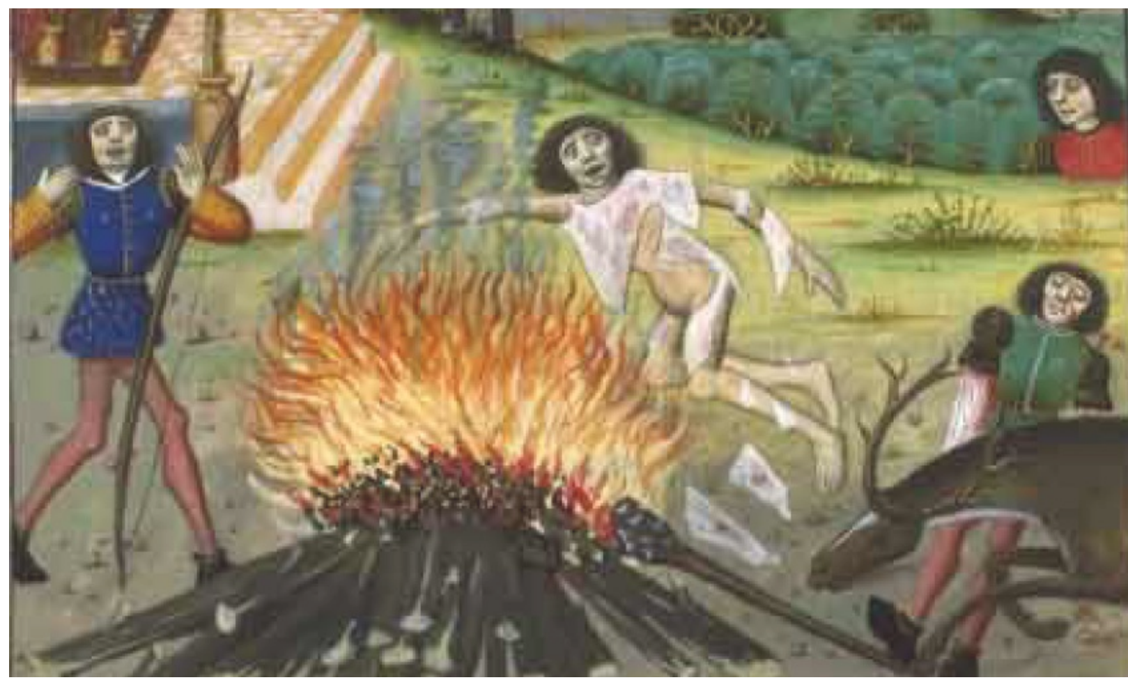
Herkül'ün ölümünün işlendiği 15. yüzyıldan kalma bir resim.

Yeniden özgür kalan Herkül, uzun zamandır aklında olan ve bir türlü fırsat bulmadığı bir işi tamamlamaya karar verdi. Onun en büyük arzularından birisi, Troias bölgesindeki Truva'ya karşı bir sefer yapmaktı. Hemen bu sefer için hazırlıklara başladı. İlk iş olarak sefere katılmak isteyen gönüllülerden bir ordu kurmaya başladı. Herkül, Kral Eurystheus'ın kendisine verdiği on iki görevinden birisi olan Amazon kraliçesi Hippolyte'nin kemeri seferinden dönerken Truva'dan geçmişti.