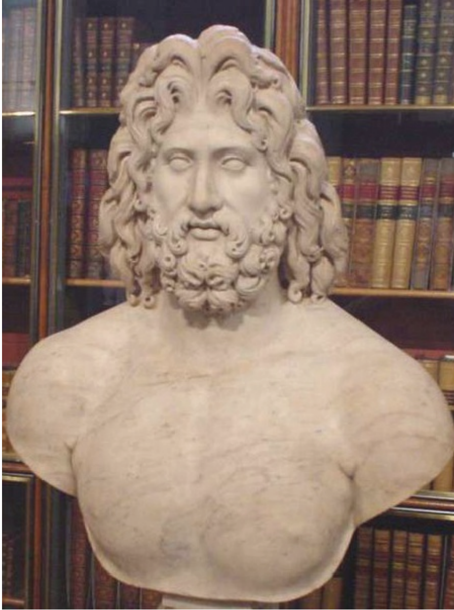
Herkül'ün babası Baş Tanrı Zeus'un British Museum'daki bir büstü.

Herkül'ün inanılmaz bir gücü vardı. Ölümlü insanlar arasında daha önceki hiçbir kahraman onunla boy ölçüşemez. Çağlar boyu kuşaklardan kuşağa aktarılan ve "Herkül gibi güçlü." sözünün doğmasına neden olan bu büyük gücün kaynağı konusunda değişik efsaneler vardır.