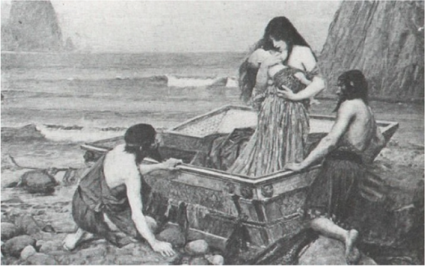
Perseus ve annesinin balıkçılar tarafından bulunması.

Uzun düşüncelerden sonra aklına bir hile geldi. Pelops'un kızı Hippodameia'yı alacağı yalanını uydurarak yakınlarına evlenme şöleni çağrısı yaptı. Bu şölene katılanların "eronos" denen armağan vermeleri gerekiyordu. Kral Polydektes, Perseus'un yiğitlik ruhunu tahrik ederek onu zor bir işe koşmayı planlıyordu. Kendisi için en makbul hediyelerden birisinin Gorganlar denilen canavarlardan birisinin başı olabileceğini söylemeye başladı.