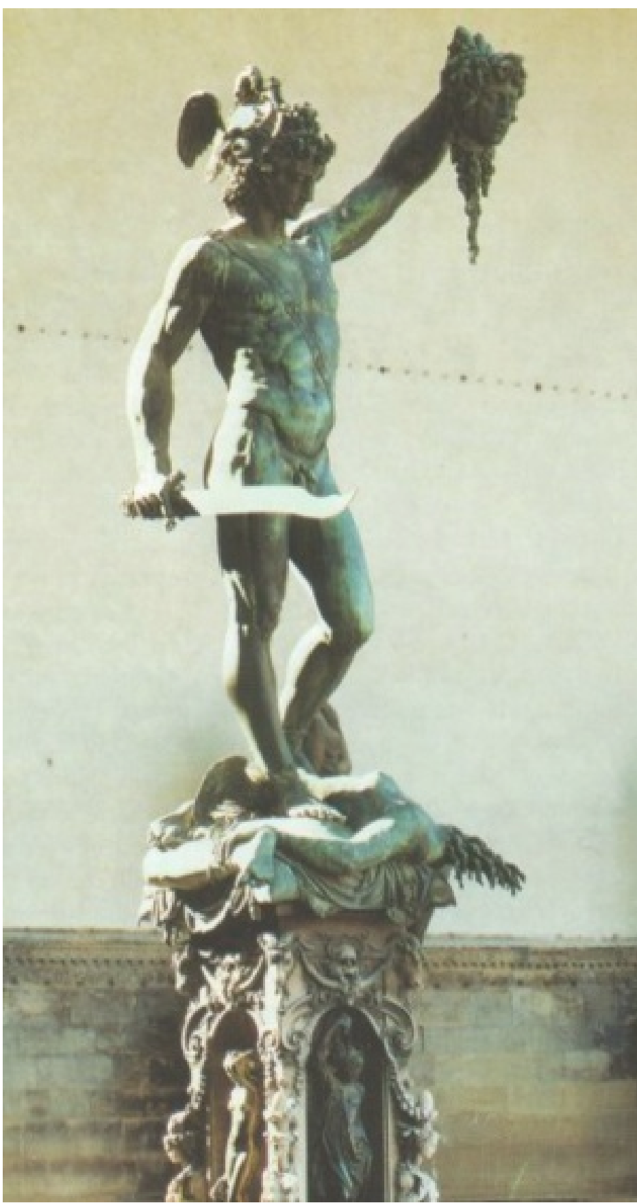
Elinde Medusa'nın kesik başını tutan Herkül.

Bu sırada hamileliğinde dokuz ayı tamamlayan Alkmene bir türlü doğum yapamıyordu. Hera'nın kızı ve doğumlardan sorumlu tanrıça olan Eileithyia, Alkmene'nin doğurmasına bir türlü izin vermiyordu. Böylece Alkmene türlü sıkıntılar ve acılar çekiyordu. Proitos'un kızı Galinthias ise Alkmene'nin dostuydu. Galinthias, Hera'nın emri ile Alkmene'nin doğumunun geciktirildiğini öğrenince çok üzüldü. Arkadaşının acılarına son vermesi için bir