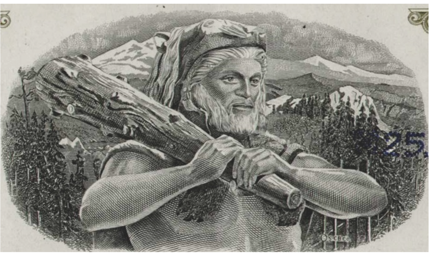
Herkül'ün tasvirlerinden biri.

İstanbul Boğazı'nı geçip Pontus Eukseinos'a açılan Argo gemisi ve Arganoutlar, Pontus Eukseinos'un Anadolu kıyılarını izleyerek doğuya doğru gitmeye başladılar. İlk uğrak yerleri Tinus'ların bulunduğu Orkinos Adası'ydı. Burada Apollon'un heybetli heykeli karşısında şaşkınlığa düştüler.