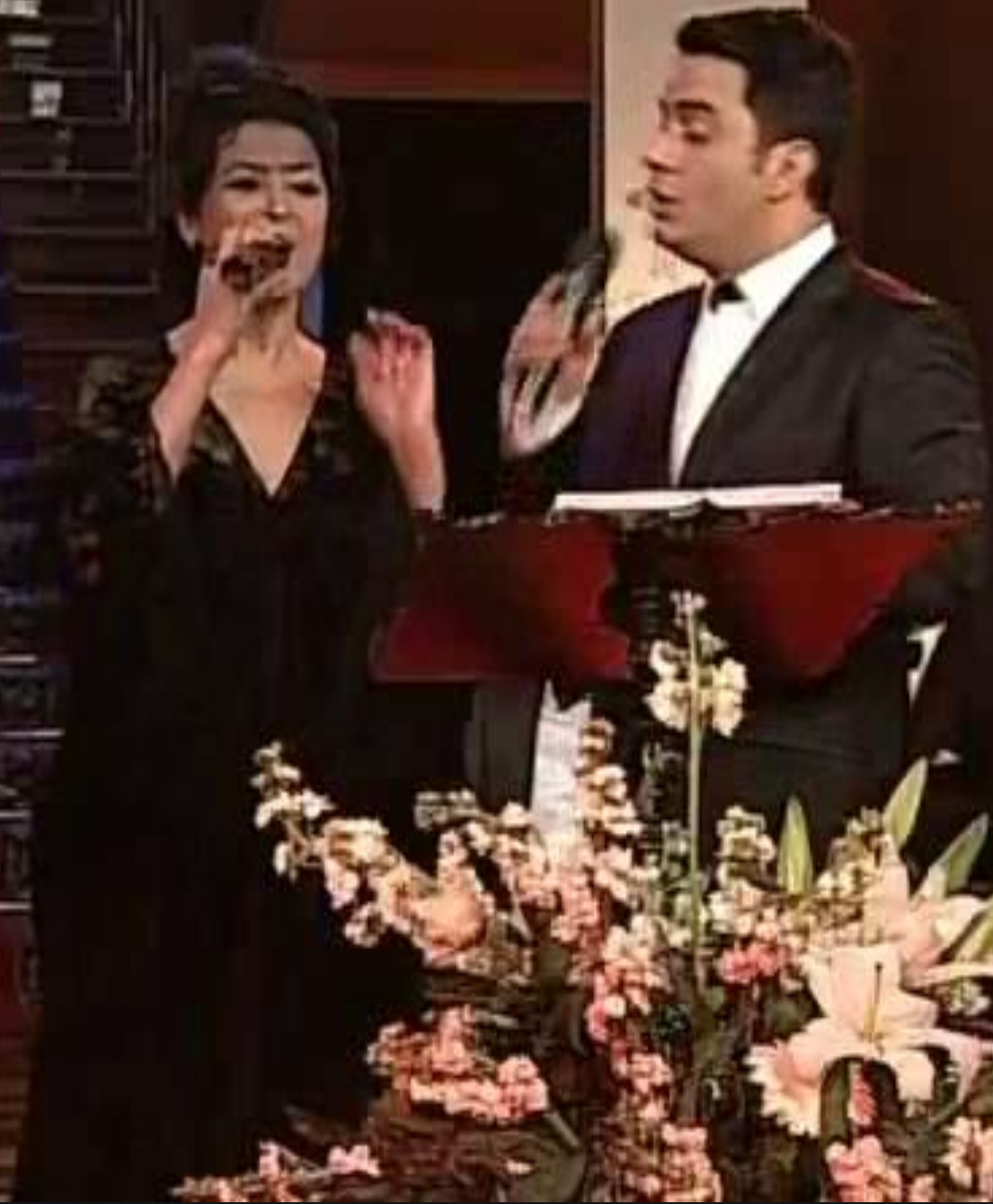
Aşkın Sihirli Sesi